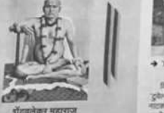
परमेश्वर जाणण्याचा मार्ग!

परमेश्वर जाणण्याचा मार्ग!... (Text discussing the path to God)